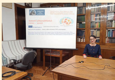
Universiteit van Plovdiv bij Universiteit van Belgrado

Het InterCultural Hotel project werd ook gepresenteerd tijdens het jaarlijkse Slavische Forum aan de Universiteit van Belgrado in januari 2023. Een deel van de deelnemers daar, die ervaring hebben in het werken met Russische gasten, gaven hun mening en deelden hun observaties in de enquête die door de partners van de Universiteit van Plovdiv was georganiseerd om ideeën te verzamelen terwijl zij begonnen te werken aan het Russische opleidingsmateriaal.