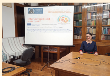
Uniwersytet w Płowdiv na Uniwersytet w Belgradzie

Projekt InterCultural Hotel został również zaprezentowany podczas corocznego Forum Słowiańskiego na Uniwersytecie w Belgradzie w styczniu 2023 roku. Część tamtejszych uczestników, którzy mają doświadczenie w hotelarstwie pracując z rosyjskimi gośćmi wyraziła swoje opinie i podzieliła się swoimi spostrzeżeniami w ankiecie zorganizowanej przez partnerów z Uniwersytetu w Płowdiv w celu zebrania pomysłów podczas rozpoczęcia pracy nad rosyjskimi materiałami szkoleniowymi.