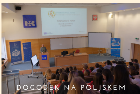
DOGODEK NA POLJSKEM