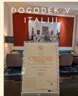
DOGODEK V ITALIJI