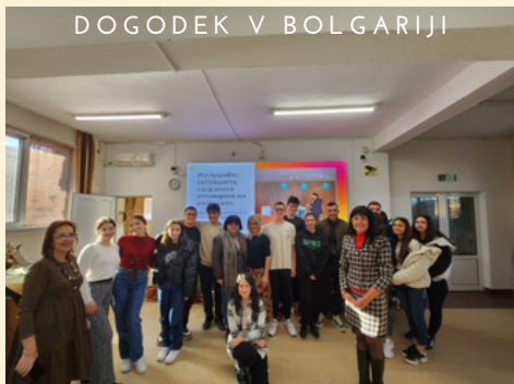
DOGODEK V BOLGARIJI