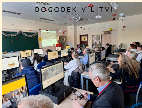
DOGODEK V LITVI