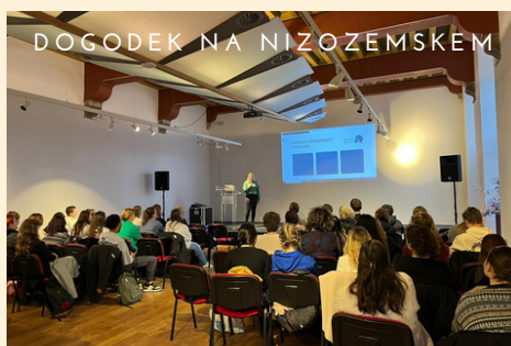
DOGODEK NA NIZOZEMSKEM