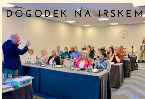
DOGODEK NA IRSKEM