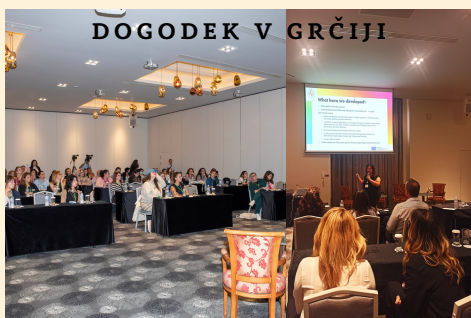
DOGODEK V GRČIJI